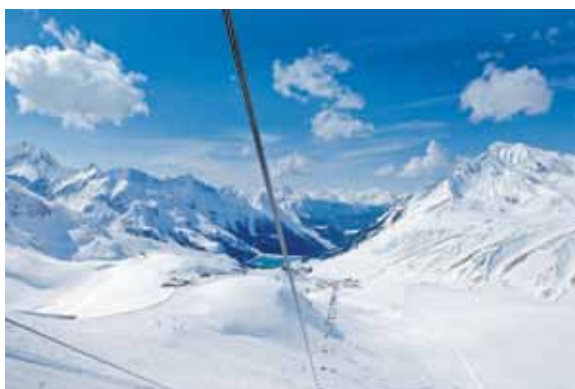
Kühtai / Happy Family Hochoetz

Preis für 7 Tage pro Familie im DZ ab € 624,-