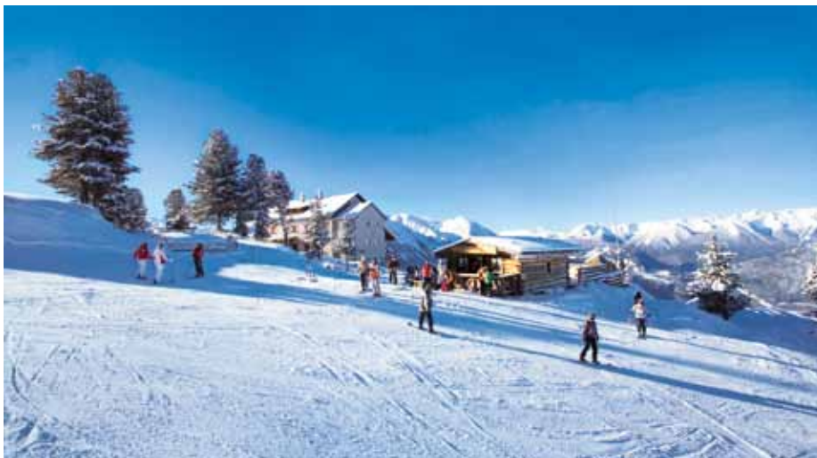
Blick auf die Bielefelder Hütte

Für Gäste des Hotel Jägerhof: 5% Ermäßigung auf Ski- und Snowboardverleih!