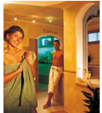
Speisesaal / Jägerstube / Hausbar / Sauna